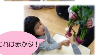
この野菜の名前な〜んだ?