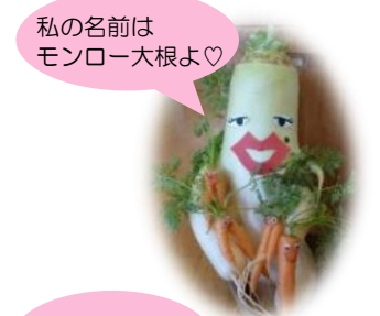
私の名前はモンロー大根よ♡

先月、冬野菜の大根とかぶの食材展示をしました。そして、白かぶ、赤かぶ、津田かぶの3種類のかぶを子どもたちに見てもらいました。かぶの名前を聞いてみると、白かぶと赤かぶはすぐに正解が出ましたが、津田かぶにはあまりなじみがないようで、「これは紫色だから、紫かぶ?」「形が長いから長かぶ?」と、いろいろな答えが出てきました。また、かぶの葉には根の10倍の栄養があることを伝えると、「えー! そうなんだ!」「全部食べられるんだね」と驚く子どもたち。食材の名前だけでなく、栄養のことも知りました。 そして、根が分かれて手足が生えているように見える大根に「モンロー大根」と名付け、展示食ケースの横に展示をしました。「人みたいだ!」「髪の毛もあるよ」と子どもたちは興味津々で見っていました。存在感抜群で、子どもだけでなく保護者の方にも大人気でした。